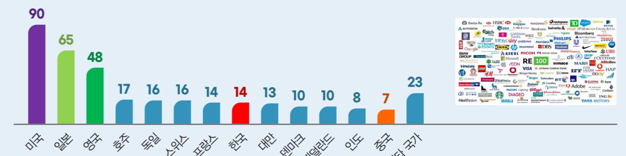
국가별 글로벌 RE100 가입 현황(총 351개사)

특히, 일본 기업들이 글로벌 경쟁력을 높이기 위해서 글로벌 RE100 가입이 활발합니다. 한국형 RE100에 가입한 국내 기업은 49개사이며, 최근 수출 기업들을 중심으로 글로벌 및 한국형 RE100에 가입을 서두르고 있습니다. (출처:한국에너지공단, '22년 2월 기준)